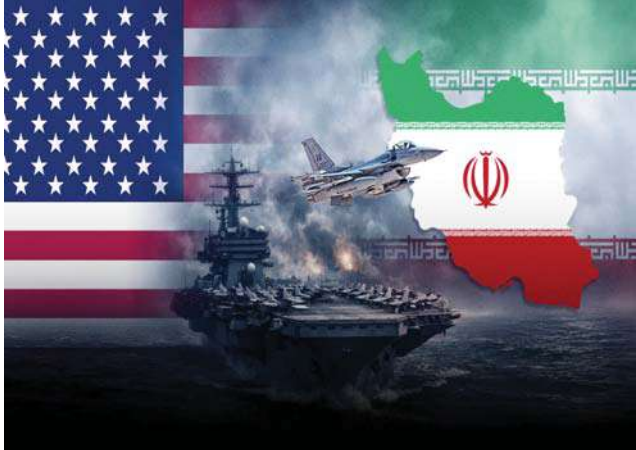
ఉల్లంఘించిందని ఆరోపించింది. దీనికి తాము కూడా ప్రతీకారం తీర్చుకుంటామని, అందుకే ఈ తాజా

టెహ్రాన్, జూలై 8 : పశ్చిమాసియాలో మళ్ళీ అగ్ని రాజుకుంటోంది. పశ్చిమాసియా మరోసారి నిప్పుల కొలిమిగా మారింది. అమెరికా-ఇరాన్ పరస్పర దాడులతో గల్ఫ్ దేశాల్లో సైరస్ మోత మోగుతోంది. అగ్రరాజ్య దాడులపై తీవ్రంగా మండిపడ్డ టెహ్రాన్.. ప్రతీకార దాడులు మొదలుపెట్టింది. బహ్రయిన్, కువైట్లలో అమెరికాకు చెందిన 85 సైనిక స్థావరాలను లక్ష్యంగా చేసుకుని క్షిప్రబులు ప్రయోగించింది. హుజుస్టా జలసంధిలో వాణిజ్య నౌకలపై దాడులకు ప్రతిస్పందన.. ఇరాన్ వైమానిక రక్షణ వ్యవస్థలు, తీరప్రాంత నిఘా వ్యవస్థలపై అమెరికా వైమానిక దాడులు చేసింది. దీనిపై ఐఆర్ఆఫ్సీ తీవ్రంగా స్పందించింది. కాల్పుల వివరాలు ఒప్పందాన్ని అగ్రరాజ్యం