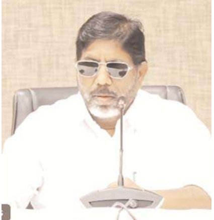
చేసుకోవడంపై మండిపడ్డారు. వాస్తవాలను పూర్తిగా పక్కన పెట్టి, ప్రజలను తప్పుదోవ

హైదరాబాద్, జూలై 8 : సింగరేణి బొగ్గు గనుల కేటాయింపులపై కేంద్ర ప్రభుత్వం చేస్తున్న ప్రకటనలను ఉప ముఖ్యమంత్రి భట్టి విక్రమార్కు తీవ్రంగా ఖండించారు. సింగరేణి కాలరీస్ కు తాడిచెర్ల-2 బొగ్గు భాగిన తామే కొత్తగా కేటాయించామని, దానికి సంబంధించిన కొన్ని క్లియరెన్సులు ఇవ్వమని కేంద్ర పెద్దలు ప్రచారం