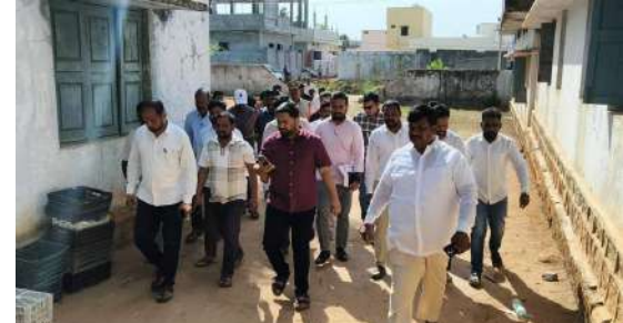
వెండ్రంటో తీసి హాస్టల్ ను సందర్శిస్తున్న జిల్లా కలెక్టర్ (డైరీ ఫోటో)