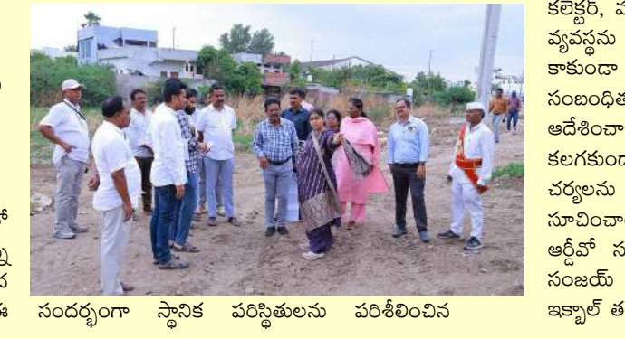
సందర్భంగా స్థానిక పరిస్థితులను పరిశీలించిన