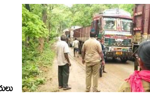
వెంకటాపురం ప్రధాన రహదారి లాల్లీలతో నిత్యం ట్రాఫిక్ జాం