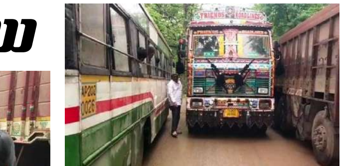
రోడ్డు పై అసవ్యసంగా లాల్లీలు

సమస్య కూడా కోల్పోయే పరిస్థితి వచ్చింది , ఈ సమస్యకు పరిష్కారం కోసం మండల ప్రజలు ఎదురుచూస్తున్నారు. కరకట్ట గోదావరి అడ్డుకట్ట మాత్రమేనా ఇసుక లాల్లీల ప్రయాణానికి ప్రణాళిక చేయలేరా చర్ల మండల శివారులో వెంకటాపురం ప్రధాన రహదారిపై ఉన్నటువంటి ఇసుక వనరు మేలిమి ఇసుక కావడంతో ఈ ఇసుక ర్యాంపుల కోసం ఇతర రాష్ట్రాల నుంచి పెట్టుబడిదారులు వచ్చి బినామీ పేర్లతో వ్యాపారం చేస్తున్నారు , ఇసుక వ్యాపార అవకాశాలను ప్రధాన అడ్డగా చర్ల వెంకటాపురం మండలాలు నిలుస్తున్నాయి, ఇసుక వ్యాపారంతో కోట్లు గడుస్తున్న కాంట్రాక్టర్లు, గుత్తేదారులు, రవాణా వ్యవస్థకు సరైన మార్గాన్ని తెప్పికోకుండా ప్రజా ఉపయోగమైనటువంటి రహదారులను ఉపయోగించడంతో రహదారులన్నీ ధ్వంసమై ప్రజలకు తీవ్ర అటంకాలను కలిగిస్తున్నాయి , చర్ల మండలానికి గోదావరి అనుకొని ఉండడంతో గోదావరి సీతమ్మ ప్రాజెక్టు బ్యాక్ వాటర్ వరద తాకిడిని తట్టుకునేందుకు కరకట్ట నిర్మాణం జరిగింది. ఈ నిర్మాణం కూడా అసహజపూర్తిగా జరగడంతో ఎటు ఉపయోగపడదనీ పరిస్థితి ఉంది. ఈ కరకట్ట నిర్మాణం పూర్తిగా నిర్లబ్ధమైపోయింది సూరసరి భద్రాచలంలోని గోదావరి బ్రిడ్జి వరకు కరకట్ట ద్వారా ఇసుక లాల్లీలను ప్రత్యేకంగా తరలించవచ్చు అవకాశం ఉన్నప్పటికీ ఈ మార్గాన్ని ఎంచుకోకపోవడం అభివృద్ధి చేయకపోవడం తో చర్ల మండలం వెంకటాపురం భద్రాచలం ఇసుక లాల్లీల తో రహదారులన్నీ దారి తోవని పరిస్థితిలో ఉన్నాయి , ఎక్కడికక్కడ గుంతలమయం గా మారి రాకపోకలకు పెద్ద అటంకంగా నిలుస్తున్నాయి ఇసుక లాల్లీల తో ఏర్పడుతున్న సమస్యలను పరిష్కరించే దిశగా అధికారులు చర్యలు తీసుకోవాలని ప్రజల సంక్షేమాన్ని గుర్తుంచుకొని జిల్లా అధికారులు ముందుకు రావాలని మండల ప్రజలు కోరుతున్నారు.