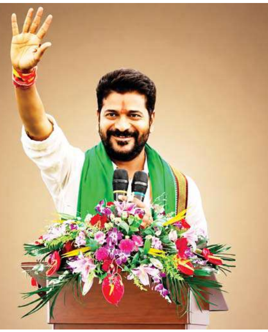
తెలంగాణ సీఎం గా ప్రమాణ స్వీకారం చేస్తూ..

ప్రేమ ఇప్పటికీ అలాగే ఉంది” అని స్థానిక నాయకులు చెబుతున్నారు. తమ గడ్డపై నుంచి ఎదిగిన బిడ్డ సీఎం అయి తిరిగి మిడ్డిల్ కు రావడం తమ అదృష్టమని, ఇది మండలానికే గర్వకారణమని ప్రజలు ఆనందం వ్యక్తం చేస్తున్నారు. రాజకీయ జీవితానికి బీజం వేసిన మిడ్డిల్ గడ్డకు, కోరిన కోరికలు తీర్చే పబ్లిసిటీ అంజనేయస్వామికి సీఎం రేవంత్ రెడ్డి ఇస్తున్న కానుక ఇది అంటూ ప్రజలు ఆనందాన్ని వ్యక్తం చేస్తూ జడ్పీటీసీగా ఇచ్చిన మాటను సీఎంగా నిలబెట్టుకుంటున్నారనే చర్చ మిడ్డిల్, ఊర్గాండ మండలాల్లో జోరుగా సాగుతోంది..