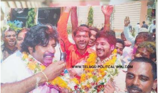
2006 సంవత్సరంలో జడ్పీటీసీ గా గెలుపొందిన సందర్భంగా... ఉమ్మడి పాలమూరు జిల్లా ప్రతినిధి, 04 (విజన్ ఆంధ్ర):

ఉమ్మడి మహబూబ్ నగర్ జిల్లాలోనే అత్యంత ప్రసిద్ధి చెందిన అంజనేయ క్షేత్రాల్లో ఊర్గాండ పబ్లిసిటీ అంజనేయ స్వామి ఆలయం ఒకటి. భూత, ప్రేత, పితృ భాదలతో వచ్చే భక్తులకు ఇక్కడి స్వామి అభయమిస్తాడని ప్రగాఢ నమ్మకం. ప్రతి మంగళ, శనివారాల్లో ఉమ్మడి పాలమూరు జిల్లా నలుమూలల నుంచే కాకుండా ఇతర జిల్లాల నుంచి కూడా భక్తులు దండోపదండాలాగా తరలివస్తారు. అయితే సరైన వసతులు, అభివృద్ధి లేక ఆలయం ఎదుగుదలకు నోచుకోలేదు. ఈ నేపథ్యంలో సీఎం పర్యటన, నిధుల ప్రకటన ఆలయ రూపురేఖలను పూర్తిగా మార్చేయనుందని అధికారులు చెబుతున్నారు. రాజగోపురం, ప్రహారీ, కళ్యాణ మండపం, భక్తుల విడిది గదులతో పాటు పర్యాటకంగా అభివృద్ధి చేసేందుకు మార్సెల్ ప్లాన్ సిద్ధమవుతోంది.