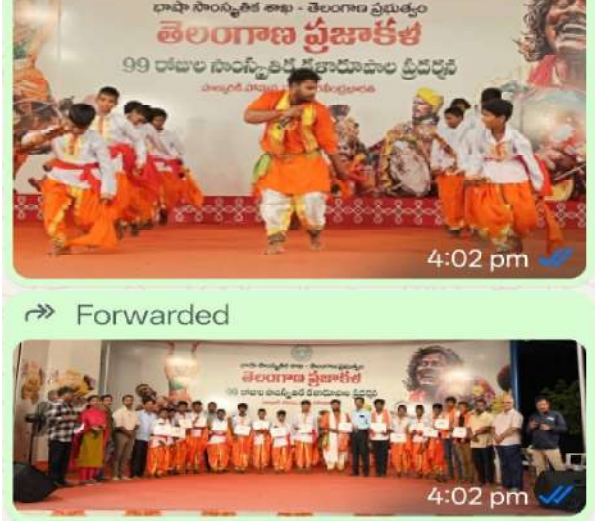
హైదరాబాద్ జూలై 2026, విజన్ ఆంధ్ర (ఆకెళ్ళ విశ్వానాథ్): తెలంగాణ బాషా సాంస్కృతిక శాఖ ప్రతిష్ఠాత్మకంగా నిర్వహిస్తున్న తెలంగాణ ప్రజాకళ 99 రోజుల కళా మహోత్సవంలో భాగంగా 93వ రోజు గురువారం