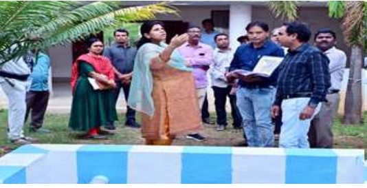
ఐ.డి.ఓ. సీలో రూఫ్ వాటర్ హార్వెస్టింగ్ ప్రొక్టర్లు