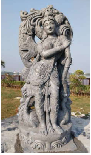
వేములవాడ టెంపుల్ ఏరియా డెవలప్మెంట్ అథారిటీ (వీటీఏఏఎం) అధ్యక్షులు ఈ ప్రాజెక్టు ద్వారా గుడి చెరువు పరిసర ప్రాంతాన్ని సుందరికరించడంలో పాటు భక్తులు, పర్యాటకులు విశ్రాంతి తీసుకునేలా

ప్రత్యేక ఆకర్షణగా 40 అడుగుల మహాశివుడి విగ్రహం, సప్తమాతృకల ప్రతిమలు త్వరలో అందుబాటులోకి బోటింగ్ సదుపాయం.. పర్యాటకాభివృద్ధికి కొత్త ఊపు