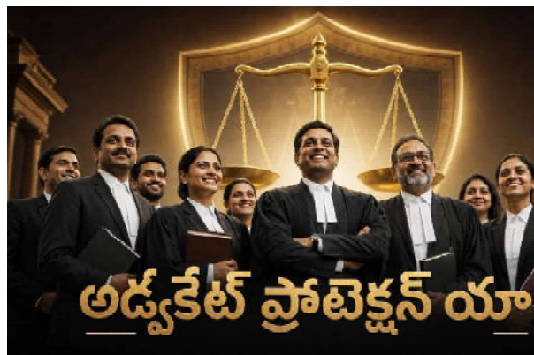
హైదరాబాద్, జూన్ 3 న్యాయవాదుల రక్షణకు సంబంధించి తెలంగాణ ప్రభుత్వం తీసుకువచ్చిన అడ్వకేట్ ప్రాటెక్షన్ యాక్ట్, 2026, జూన్ 2,