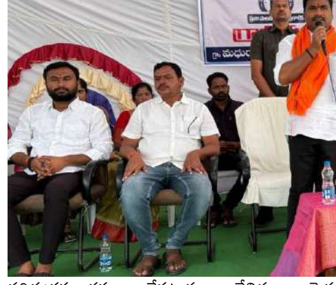
అరెన్ అరెన్ రాష్ట్ర వ్యాప్తంగా గుర్తింపు..