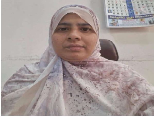
ఎస్ఐఆర్ ఐఫ్ అఫీసర్, సబ్ ఇన్స్పెక్టర్, ఆడిటర్, అకౌంటెంట్, ట్యూక్ ఇన్స్పెక్టర్, పోస్టల్ అసిస్టెంట్, జూనియర్ స్టాఫ్ అఫీసర్ తదితర ఉద్యోగులకు ఈ కోచింగ్ ద్వారా నియామకాలు చేపట్టనున్నట్లు

రాజన్న సిరిసిల్ల, జూన్ 19 (విజన్ ఆంధ్ర) బ్యారో: రాష్ట్ర, కేంద్ర ప్రభుత్వ పోలీ పరీక్షలకు సిద్ధపడుతున్న మైనారిటీ అభ్యర్థుల కోసం తెలంగాణ మైనారిటీస్ స్టడీ సర్కిల్ అండ్ కెరీర్ కౌన్సిలింగ్ సెంటర్ అభ్యర్థులలో నాలుగు నెలల ఉచిత బేసిక్ ఫౌండేషన్ కోచింగ్ కార్యక్రమాన్ని నిర్వహిస్తున్నట్లు జిల్లా మైనారిటీ సంక్షేమ అధికారి అయిమె తలత్ ఒక ప్రకటనలో తెలిపారు. ఈ కోచింగ్ ద్వారా గ్రూప్ 1, గ్రూప్ 2, గ్రూప్ 3, గ్రూప్ 4, బి.ఎస్.సి. సివిల్ సర్వీసెస్, SSC/CGL, RRB అసిస్టెంట్ లోకో పైలెట్, ==డి టెక్నిషియన్, తెలంగాణ పోలీస్ నియామకాలు, xగ్రూప్ తదితర రాష్ట్ర, కేంద్ర ప్రభుత్వ పోలీ పరీక్షలకు నిపుణుల ద్వారా శిక్షణ అందించనున్నట్లు పేర్కొన్నారు. ప్రత్యేకంగా గ్రూప్-బి+ 2026 ద్వారా దేశవ్యాప్తంగా సుమారు 12,256 ఉద్యోగ భాగీని భర్తీకి అవకాశం ఉండటంతో ఈ కోచింగ్ అభ్యర్థులకు ఎంతో ఉపయోగపడుతుందని తెలిపారు. అసిస్టెంట్ సెక్షన్ ఆఫీసర్, ఇన్ కమే ట్యూక్ ఇన్స్పెక్టర్, అసిస్టెంట్