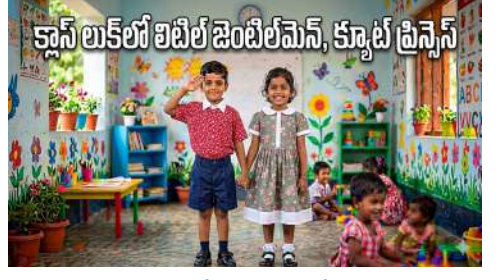
క్లాస్ లుక్లో లిటిల్ జెంటిల్ మెన్, క్యూట్ ప్రిన్స్

ఇక ఇంటి మహాలక్ష్మిలైన బాలికల కోసం... ఎంతో అందమైన రెడ్ మరీయం యాష్ రంగుల కలయికతో కూడిన ఫ్లోరల్ డిజైన్ (ఫూల డిజైన్) ఉండే ఫ్రాక్ లీడా గౌనును రూపొందించారు. ఆ పూల గౌను వేసుకుని ఇళ్ల ముందర తిరుగుతుంటే అచ్చంగా దేవకన్యల్లా కనిపిస్తున్నారు. "ఇంతకాలం ప్రైవేట్ స్కూల్ పిల్లలు ఇలాంటి చెక్స్ చొక్కాలు, ఫ్లోరల్ ఫ్రాక్స్ వేసుకుని ముస్తాబై వెళ్తుంటే... గేటు దగ్గర నిలబడి చూసేవారే. ఇప్పుడు మా పిల్లలు కూడా అదే రేంజీలో