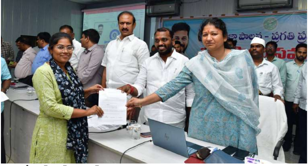
కరీంనగర్, జూన్ 19 (విజన్ ఆంధ్ర) :