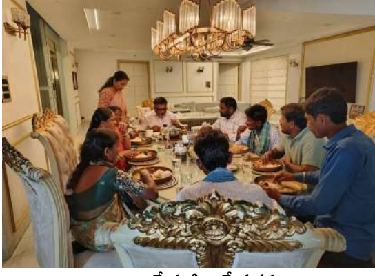
ఒకే పంక్తి, ఒకే మనసు

పెద్దపల్లి బ్యూటీ చీఫ్, జూన్ 19 (విజన్ ఆంధ్ర): మంధని నియోజకవర్గం మల్లీ ఒకసారి మానవీయతకు నిలువెత్త సాక్ష్యంగా నిలిచింది.