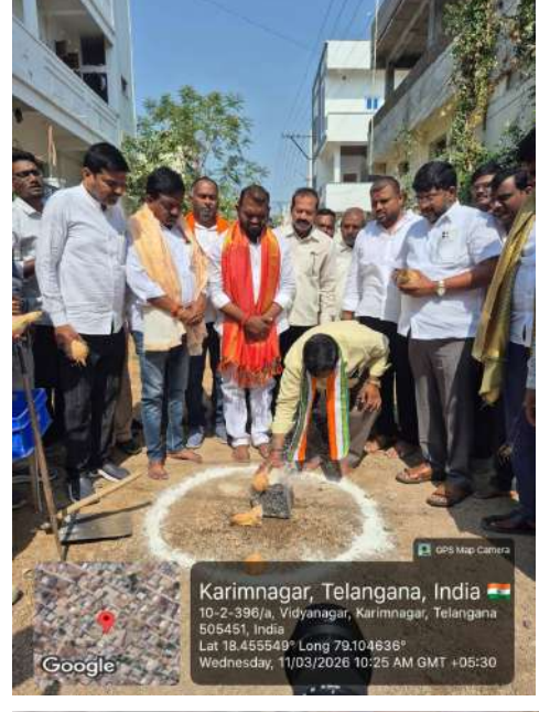
Karimnagar, Telangana, India