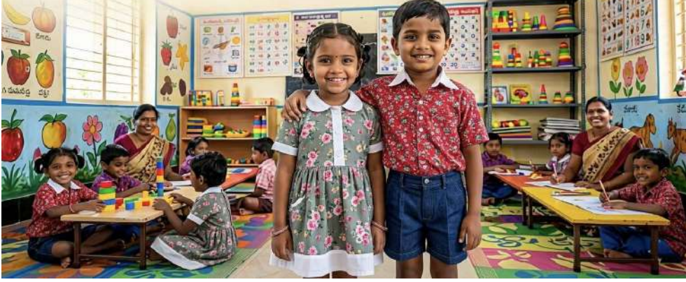
టీల్ జెంటిల్ మెన్ (బాలురు)

ఆ బుజ్జాయిలు చిరునవ్వులు... ఆ బుడి బుడి అడుగుల నవ్వులు... ఎప్పుడూ ఒకటే సందడి. కానీ ఈసారి సీన్ మారింది! ఆ ముద్దులొలికే ముఖాల్లో మురిపెం రెల్లించింది. ఎందుకంటే, తెలంగాణ ప్రభుత్వం అంగన్వాడీ కేంద్రాల్లోని చిన్నారుల కోసం సరికొత్త 'స్టైల్ స్టేట్ మెంట్' తీసుకొచ్చింది. ఈ ఏడాది నుంచి పిల్లల సరికొత్త యూనిఫామ్లను అందిస్తూ, అంగన్వాడీలను అచ్చంగా కార్పొరేట్ స్కూల్స్ కు దీటుగా ముస్తాబు చేసింది.