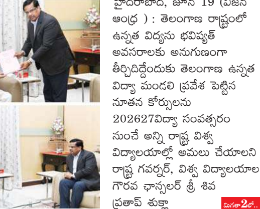
హైదరాబాద్, జూన్ 19 (విజన్ ఆంధ్ర) : తెలంగాణ రాష్ట్రంలో ఉన్నత విద్యను భవిష్యత్ అవసరాలకు అనుగుణంగా తీర్చిదిద్దేందుకు తెలంగాణ ఉన్నత విద్యా మండలి ప్రవేశ పెట్టిన సూతన కోర్సులను 202627విద్యా సంవత్సరం నుంచే అన్ని రాష్ట్ర విశ్వ విద్యాలయాల్లో అమలు చేయాలని రాష్ట్ర గవర్నర్, విశ్వ విద్యాలయాల గౌరవ ఛాన్సలర్ శ్రీ శివ ప్రతాప్ శుక్లా

ఉన్నత విద్యలో తెలంగాణ దేశానికే ఆదర్శం కావాలి: గవర్నర్ శివ ప్రతాప్ శుక్లా