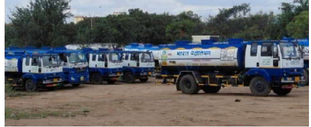
సైపర్ అవరేషన్ డీమ్ (ఎన్.టి.టి), స్థానిక పోలీసు యంత్రాంగం ఈ అంశంపై దృష్టి సారించలేదనే విమర్శలు వినిపిస్తున్నాయి. అసమానానుకూలంగా నిలిపి ట్యాంకర్లు, వారి కార్యకలాపాలపై తనిఖీలు జరిగాయో లేదా అనే అంశంపై అధికారిక సమాచారం లేకపోవడం మరిన్ని ప్రశ్నలకు దారితీస్తోంది.

ఘోరములు అందినా చర్యలు ఎందుకు తీసుకోవడం లేదు..? స్థానికులు పలుమార్లు ఫిర్యాదులు చేసినట్లు చెబుతున్నప్పటికీ, వాటిపై ఎలాంటి చర్యలు తీసుకున్నారో ప్రజలకు తెలియడం లేదు. ఫిర్యాదులపై విచారణ జరిగిందా? సంబంధిత శాఖలు తనిఖీలు నిర్వహించాయా? లేక ఫిర్యాదులు పైశ్చక్రే వరిమితమయ్యాయా? అనే ప్రశ్నలు ఉత్పన్నమవుతున్నాయి. ప్రజల సంక్షేమంపై నిపుటి చేయాల్సిన బాధ్యత అధికారులపై ఉందని స్థానికులు అంటున్నారు. సహలస్పన్న రెవెన్యూ, హెచ్ఎండిపి అధికారులు..? ప్రభుత్వ భూముల అసెస్సర్లను వినియోగించి చర్యలు తీసుకోవాల్సిన రెవెన్యూ, హెచ్ఎండిపి అధికారులు మోసం చేస్తున్నారనే ఆరోపణలు వినిపిస్తున్నాయి. పర్యవేక్షణ లోపం అక్రమాలకు అవకాశంగా మారడంపై స్థానికులు ప్రశ్నిస్తున్నారు. రిపోర్ట్ల పేర్లతో అక్రమాలకు రక్షణ..? ఈ వ్యవహారంలో మరో కీలక అంశం ఏమిటంటే కోందరు వ్యక్తులు మీడియా ప్రతినిధులను పేర్లు ఉపయోగిస్తూ అధికారులపై ప్రభావం చూపుతున్నారనే ఆరోపణలు వినిపించడం. జర్నలిస్టుల పేర్లు ఆధారంగా పెట్టుకుని అక్రమ కార్యకలాపాలకు రక్షణ కల్పిస్తున్నారా? లేక కొందరు వ్యక్తులు తమ ప్రయోజనాల కోసం మీడియా పేరును దుర్వినియోగం చేస్తున్నారా? అనే అంశంపై కూడా విచారణ జరగాల్సిన అవసరం ఉందని స్థానికులు అభిప్రాయపడుతున్నారు. హెచ్ఎండిపి భూముల్లో భారీ వాహన పార్కింగ్ పై సమగ్ర విచారణ చేపట్టాలి. భూముల వినియోగానికి సంబంధించిన అనుమతులను బహిష్కరించేవాలని, అక్రమ ఇంధన దండపై పౌర సరఫరాల శాఖ, ఎన్.టి.టి, పోలీసులు సంయుక్తంగా తనిఖీలు నిర్వహించాలని స్థానికులు కోరుతున్నారు. ఆరోపణల్లో వాస్తవం లేకపోతే ప్రజలకు సృష్టణ ఇన్వాలిడ్, ఒకవేళ అక్రమాల జరిగితే బాధ్యులపై కఠిన చర్యలు తీసుకోవాలని డిమాండ్ చేస్తున్నారు.