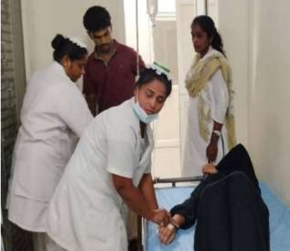
సమాధానం చెప్పేది ఎవరు?

ఇప్పుడైనా? ఇది ముమ్మాటికీ కళాశాల ప్రిన్సిపాల్, హాస్పిటల్ వార్డెన్ పర్యవేక్షణ లోపమే!! విద్యార్థుల భద్రతను గాలికి వదిలేసి, వారు ఎటు వెళ్తున్నారో, ఏం తింటున్నారో అనే కనీస పట్టించు లేకుండా వ్యవహరించడం వల్ల ఈ రోజు ఇంత పెద్ద ప్రమాదం జరిగింది.