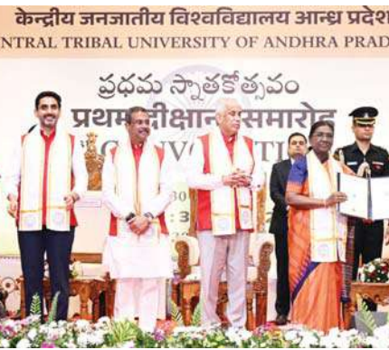
విశాఖపట్నం, జూన్ 30 : దేశ నిర్మాణంలో విద్యావంతులైన యువతదే అత్యంత కీలక భూమిక అని భారత రాష్ట్రపతి ద్రౌపది ముర్ము స్పష్టం చేశారు. మంగళవారం విశాఖపట్నంలోని కేంద్రీయ గిరిజన విశ్వవిద్యాలయం మొదటి స్నాతకోత్సవ కార్యక్రమాన్ని

కేంద్రీయ జనజాతీయ విశ్వవిద్యాలయ ఆంధ్ర ప్రదేశ్ CENTRAL TRIBAL UNIVERSITY OF ANDHRA PRADESH ప్రధమ స్నాతకోత్సవం ప్రథమోత్సవం ప్రథమోత్సవం