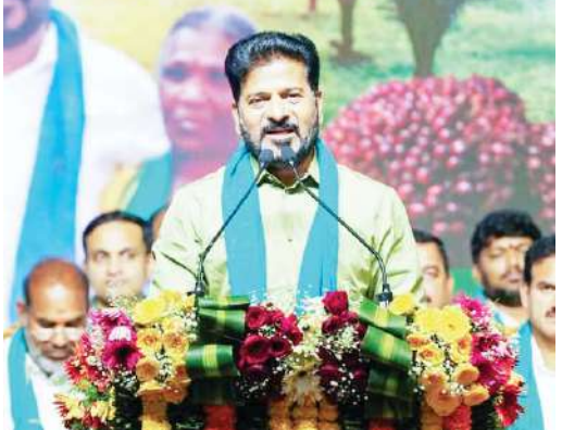
హైదరాబాద్, జూన్ 30 : తెలంగాణలో రైతు భరోసా నిధులను ముఖ్యమంత్రి రేవంత్ రెడ్డి విడుదల చేశారు. తొలి విడతలో రెండు ఎకరాల లోపు భూమి కలిగిన 44.28 లక్షల మంది రైతుల ఖాతాల్లో రూ.2,482 కోట్లను

సిద్దిపేట జిల్లాలోని మాస్టాబాద్ పట్టణంలో మంత్రి పాన్డం ప్రభాకర్ పర్యటించారు. ఈ సందర్భంగా పట్టణంలోని 17, 18 వార్డుల్లో కొనసాగుతున్న సర్ ఓటర్ సవరణ పత్రీయను పరిశీలించారు. అనంతరం మీడియాతో మాట్లాడుతూ.. ఎరువుల తయారీ, సరఫరా కేంద్రం పరిధిలోని అంకమన్నారు. ఏ రాష్ట్రంలో కూడా ఎరువులు తయారు చేసుకోకదని తెలిపారు. కేంద్ర ప్రభుత్వం తయారు చేసే ఎరువులతో పాటుగా తెలంగాణలో ఉన్న ఎరువుల పర్ఫెక్టెజర్ ఫ్యాక్టరీని తెలంగాణ రాష్ట్రానికి