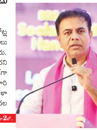
హైదరాబాద్, జూన్ 30 : 30 నెలల పాలనలో రూ.30 వేల కోట్ల రైతుభరోసా నిధులను ఎగ్గొటారని, హైగా సభల పేరుతో నాటకాలు ఆడుతున్నారని కెటిఆర్ ప్రసాద్ కెటిఆర్ మండిపడ్డారు. ఏకంగా నాలుగుసార్లు రైతు భరోసా నిధులను ఎగ్గొటారని ఆరోపించారు. ఈ మేరకు ముఖ్యమంత్రి రేవంత్ రెడ్డి టార్గెట్ గా మాజీ మంత్రి, బీఆర్ఎస్ వర్కింగ్ ప్రెసిడెంట్ కేటిఆర్ మరోసారి విమర్శలు గుప్పించారు. మంగళవారం హైదరాబాద్ శిల్పకళా వేదికలో సిఎం రేవంత్ రైతు భరోసా నిధులను విడుదల చేయనున్నారు. ఈ క్రమంలో ప్రభుత్వంపై ఎస్సీ వేదికగా మాజీ మంత్రి విరుచుకుపడ్డారు. మీ 30 నెలల ముదసప్తపు