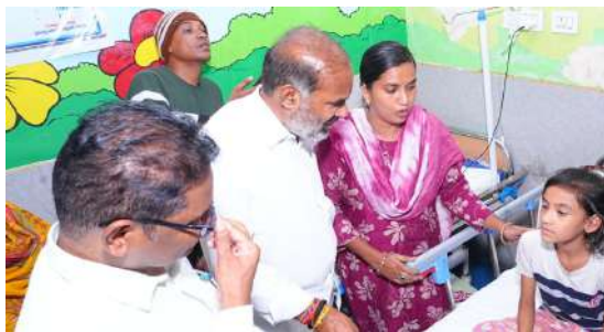
ఆస్పత్రిలో చికిత్స పొందుతున్న బాధితులను పరామర్శించిన ప్రభుత్వ విప్..