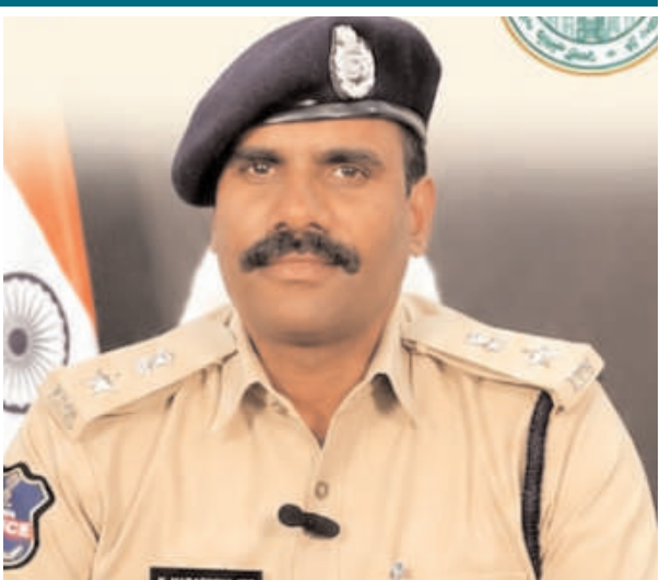
అదాలత్ ద్వారా బాధితులకు సత్వరమే న్యాయం జరుగుతుందన్నారు.