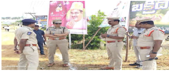
వనపర్తి, మే 28 (విజన్ ఆంధ్ర బ్యూరో) : బక్రీద్ పర్వదినం సందర్భంగా ఏర్పాటు చేసిన బందోబస్తు విధులను జిల్లా ఎస్పీ సునిత రెడ్డి పరిశీలించారు. అక్కడ ఏర్పాటు చేసిన భద్రతా చర్యలు, ట్రాఫిక్ నియంత్రణ, పార్కింగ్ సదుపాయాలు, ప్రజలకు అందిస్తున్న సౌకర్యాలపై అధికారులతో జిల్లా ఎస్పీ సమీక్ష నిర్వహించి పలు సూచనలు చేశారు.