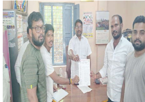
అధికారులకు వినతిపత్రం సమర్పిస్తున్న నాయి బ్రాహ్మణ సంఘం నాయకులు.