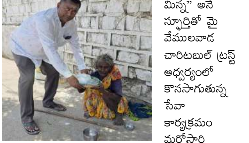
కెల్లా అన్నదానం మిన్న" అనే స్ఫూర్తితో మై వేములవాడ చారిటబుల్ ట్రస్ట్ ఆధ్వర్యంలో కొనసాగుతున్న సేవా కార్యక్రమం మరోసారి

వేములవాడ, మే 29 (విజన్ ఆంధ్ర): "అన్ని దానాల్లో