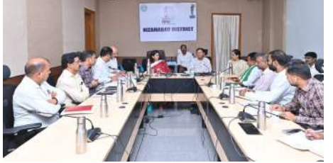
పరిమితం కాకుండా పెద్ద వ్యాపారాల్లోకి రావాలని ముఖ్యమంత్రి పిలుపునిచ్చారు. రైన్ మిల్లులు, మండల స్థాయిలో గోదాములు, లాజిస్టిక్ పార్కులు నిర్మించుకోవాలని సూచించారు. వాటికి అవసరమైన చోట భూములను కేటాయించేందుకు ప్రభుత్వం సిద్ధంగా ఉందని చెప్పారు. అవసరమైతే 100 ఎకరాల వరకు భూములు ఇప్పడానికి సిద్ధమని అన్నారు. ధాన్యం కొనుగోలు, నిల్వ, మిల్లింగ్ వ్యవస్థలో మహిళా సంఘాల పాత్ర పెరగాలని సీఎం అన్నారు. సంఘాల వద్ద కొనుగోలు చేసి, బియ్యం ప్రభుత్వానికి అందించేలా చర్యలు తీసుకుంటామని చెప్పారు. ఆడిషన్లు ప్రతి గింజుకు జవాబుదారులుగా ఉంటారని, వారి చేతుల్లోకి ఈ వ్యవస్థ వెళ్లే పారదర్శకత, బాధ్యత మంటే పెరుగుతుందన్నారు. మహిళా సంఘాల ఆధ్వర్యంలో కార్యక్రమాలకు మహిళా శక్తి సూపర్ బజార్లు నెలకొల్పాలని ముఖ్యమంత్రి సూచించారు. డిమాండ్, బిగ్ బజార్లకు బోటిగా ఉండేలా అధ్యక్షమైన మహిళా శక్తి సూపర్ బజార్లు ఏర్పాటు చేయాలని అన్నారు. పట్టణాల్లో సూపర్ బజార్ ఏర్పాటుకు తక్కువ ధరకు స్టాలను లీజుకు ఇచ్చేందుకు ప్రభుత్వం సిద్ధంగా ఉందని చెప్పారు. నాణ్యమైన వస్తువులు ప్రజలకు అందుబాటులోకి రావాలి, రైతుల ఉత్పత్తులకు మార్కెట్ దరకాలి, మహిళా సంఘాలకు అదాయం రావాలి అన్నదే ఈ ఆలోచన వెనుక ఉన్న లక్ష్యమని వివరించారు. రాష్ట్ర ప్రభుత్వం కూడా మహిళా శక్తి సూపర్ బజార్లలో మాటలాడుతూ ఉంటుందని, రైతులు సంబంధించి మంచి పంటలు, అర్థానికి ఉత్పత్తులు, నిత్యావసర సరకులు వీటి ద్వారా వినియోగదారులకు చేరేలా చూడాలని అన్నారు. గ్రామీణ ఉత్పత్తులకు మంచి మార్కెట్ లభిస్తే రైతులకు మేలు జరుగుతుందని, వినియోగదారునికి నాణ్యమైన వస్తువు, మహిళా సంఘాలకు అదాయం లభిస్తుందని చెప్పారు. ఒకే