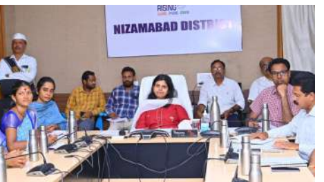
పరిమితం కాకుండా పెద్ద వ్యాపారాల్లోకి రావాలని ముఖ్యమంత్రి పిలుపునిచ్చారు. రైన్ మిల్లులు, మండల స్థాయిలో గోదాములు, లాజిస్టిక్ పార్కులు నిర్మించుకోవాలని సూచించారు. వాటికి అవసరమైన చోట భూములను కేటాయించేందుకు ప్రభుత్వం సిద్ధంగా ఉందని చెప్పారు. అవసరమైతే 100 ఎకరాల వరకు భూములు ఇప్పడానికి సిద్ధమని అన్నారు. ధాన్యం కొనుగోలు, నిల్వ, మిల్లింగ్ వ్యవస్థలో మహిళా సంఘాల పాత్ర పెరగాలని సీఎం అన్నారు. సంఘాల వద్ద కొనుగోలు చేసి, బియ్యం ప్రభుత్వానికి అందించేలా చర్యలు తీసుకుంటామని చెప్పారు. ఆడిషన్లు ప్రతి గింజుకు జవాబుదారులుగా ఉంటారని, వారి చేతుల్లోకి ఈ వ్యవస్థ వెళ్లే పారదర్శకత, బాధ్యత మంటే పెరుగుతుందన్నారు. మహిళా సంఘాల ఆధ్వర్యంలో కార్యక్రమాలకు మహిళా శక్తి సూపర్ బజార్లు నెలకొల్పాలని ముఖ్యమంత్రి సూచించారు. డిమాండ్, బిగ్ బజార్లకు బోటిగా ఉండేలా అధ్యక్షమైన మహిళా శక్తి సూపర్ బజార్లు ఏర్పాటు చేయాలని అన్నారు. పట్టణాల్లో సూపర్ బజార్ ఏర్పాటుకు తక్కువ ధరకు స్టాలను లీజుకు ఇచ్చేందుకు ప్రభుత్వం సిద్ధంగా ఉందని చెప్పారు. నాణ్యమైన వస్తువులు ప్రజలకు అందుబాటులోకి రావాలి, రైతుల ఉత్పత్తులకు మార్కెట్ దరకాలి, మహిళా సంఘాలకు అదాయం రావాలి అన్నదే ఈ ఆలోచన వెనుక ఉన్న లక్ష్యమని వివరించారు. రాష్ట్ర ప్రభుత్వం కూడా మహిళా శక్తి సూపర్ బజార్లలో మాటలాడుతూ ఉంటుందని, రైతులు సంబంధించి మంచి పంటలు, అర్థానికి ఉత్పత్తులు, నిత్యావసర సరకులు వీటి ద్వారా వినియోగదారులకు చేరేలా చూడాలని అన్నారు. గ్రామీణ ఉత్పత్తులకు మంచి మార్కెట్ లభిస్తే రైతులకు మేలు జరుగుతుందని, వినియోగదారునికి నాణ్యమైన వస్తువు, మహిళా సంఘాలకు అదాయం లభిస్తుందని చెప్పారు. ఒకే

నిజామాబాద్, మే 25 : ( విజన్ ఆంధ్ర ) 2034 నాటికి కోటి మంది మహిళలను కోటి స్టార్లుగా చేస్తామని ముఖ్యమంత్రి ఎ.రేవంత్ రెడ్డి స్పష్టం చేశారు. మహిళా శక్తిని దేశానికి ఆదర్శంగా నిలబెట్టడమే ప్రజా ప్రభుత్వ సంకల్పమని అన్నారు. ‘మహిళలకు అత్యంతా నిలబడితే కుటుంబం నిలబడుతుంది, కుటుంబం నిలబడితే గ్రామం బలపడుతుంది, గ్రామం బలపడితే తెలంగాణ అభివృద్ధి చెందుతుంది..’ అన్నారు. మహిళా సంఘాలకు బ్యాంక్ లింకేజీ రుణాల పరిమితిని రూ.5 లక్షల నుంచి రూ.10 లక్షలకు పెంచుతున్నట్లు ముఖ్యమంత్రి ప్రకటించారు. సోమవారం సచివాలయం వేదికగా రాష్ట్రంలో నిర్వహించిన 8 వేల ఇందిరా గాంధీ స్త్రీ శక్తి భవనాల నిర్మాణానికి ముఖ్యమంత్రి రేవంత్ రెడ్డి వర్చువల్ గా శంకుస్థాపన చేశారు. ప్రజాపాలన ప్రగతి ప్రణాళికలో భాగంగా నిర్వహిస్తున్న మహిళా వారోత్సవాల సందర్భంగా ఈ కార్యక్రమం చేపట్టారు. మహిళలను అర్థికంగా నిలబెట్టే దిశగా ఇది చారిత్రక కార్యక్రమమని సీఎం అన్నారు. అదే వేదికపై చిలకపల్లి రంగుల్ ఉన్న ఇందిరమ్మ వీరల నాలుగు కొత్త డిజైన్లను కూడా సీఎం అవిష్కరించారు. సీఎంతో పాటు డిప్యూటీ సీఎం మల్లు భగవీరమ్మ, మంత్రి కల్వకుంట్ల తీర్థ ప్రదీప్ బాబు, ఖరీఫ్ లోని శ్రీనివాస్ రెడ్డి, రాజ్య సభ సభ్యులు వేం నరేందర్ రెడ్డి, ప్రభుత్వ సలహాదారు హర్షార వేణు గోపాల్, మహిళా కమిషన్ చైర్మన్ గద్వాల విజయ లక్ష్మి, ఎంఎల్ ఏలు, వివిధ కార్యోద్యోగ చైర్మన్లు, ఆయా విభాగాల ఉన్నతాధికారులు ఈ సమావేశంలో పాల్గొన్నారు. ఇప్పటివరకు ప్రజా ప్రభుత్వం మహిళా సంఘాలకు రూ.60,472 కోట్ల బ్యాంక్ లింకేజీ రుణాలు అందించినందుకు, వడ్డీ లేని రుణాలకు ఇప్పటికే రూ.1,390 కోట్లను చెల్లించినందుకు, మహిళా సంఘాల ఇకపై చిన్నచిన్న ఉపాధి కార్యక్రమాలకే