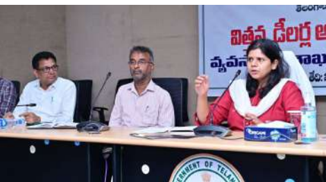
విత్తనాలు, ఎరువులు విక్రయిస్తే లైసెన్సులు రద్దు చేస్తామని, కేసులు నమోదు చేసి రికవరీ యాక్టు అమలు చేస్తామని కలెక్టర్ హెచ్చరించారు. డిలీవరీల ఇబ్బంది పెట్టాలన్నది తమ అభిమతం కాదని, ఏ ఒక్క రైతు నకిలీ విత్తనాల వల్ల నష్టపోకూడద అన్న సంకల్పంతో ఈ చర్యలు తీసుకుంటున్నామని స్పష్టం చేశారు. దీనిని దృష్టిలో పెట్టుకొని తనిఖీకి వచ్చే ఆధికారులకు సహకరించాలని డిలీవరీకు సూచించారు. జిల్లాకు ఘోషనాయ రంగంలో మంచి పేరు ఉందని, దానిని నిలుపుకొనేటట్లు బాధ్యత మన అందరిపై ఉన్నదని అన్నారు. క్షేత్రస్థాయిలో ఎరువులు విత్తనాల దుకాణాలలో తనిఖీలు నిర్వహించిన వివరాలను నివేదిక రూపంలో తనకు ఎప్పటికప్పుడూ సమర్పించాలని ఘోషనాయ ఆధికారులను ఆదేశించారు. క్రాఫ్ బుక్కింగ్ ఫార్మర్ రిజిస్ట్రీ విషయంలోనూ ఖచ్చితత్వంతో ఘోషనాయకుని కలెక్టర్ సూచించారు. లేనివకల్లో పంట సేకరణ సమయంలో ఇబ్బందులు తలెత్తే అవకాశం ఉంటుందని అన్నారు. ఈ విషయంలో నిర్లక్ష్యంగా ఘోషనాయకుని ఘోషనాయ ఆధికారులకు సూచించారు. అవగాహన సదస్సులో జిల్లా ఘోషనాయ ఆధికారి వీరస్వామి, డిఎన్ఓ శ్రీకాంత్ రెడ్డి, సివిల్ సైన్స్ డిఎం ప్రవీణ్ తదితరులు పాల్గొన్నారు.