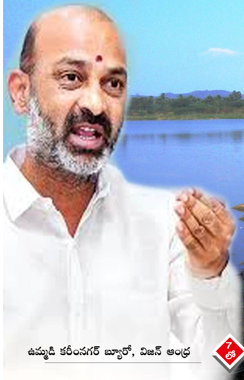
ఉమ్మడి కరీంనగర్ బ్యూరో, విజన్ ఆంధ్ర