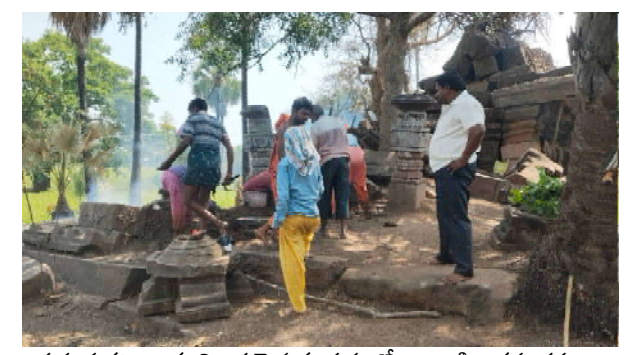
అవురూప కట్టడాలకు నిలయమైన గణపూర్ లో ఇలాంటి అక్రమ తవ్వకాలు జరుగుతున్నా పురావస్తు శాఖ గానీ, స్థానిక రెవెన్యూ అధికారులు గానీ పట్టించుకోవడం లేదని గ్రామస్థులు ఆగ్రహం వ్యక్తం చేస్తున్నారు. చారిత్రక సంపదను కొల్లగొడుతున్న వారిపై కఠిన చర్యలు తీసుకోవాలని, వెంటనే ఈ తవ్వకాలను నిలిపివేసి, ఆలయానికి రక్షణ కల్పించాలని వారు డిమాండ్ చేస్తున్నారు. ఇలా అధికారులు లేకుండా తవ్వకాలు జరిపితే అది కేవలం గుప్త నిధుల కోసమేనని ప్రజలు భావిస్తున్నారు. ఆలయ అభివృద్ధి కోసం తవ్వకాలు జరిపితే సంబంధిత అధికారులు దగ్గర్లో ఉన్నప్పుడు మాత్రమే ఈ తవ్వకాలు జరపాలని ప్రజల కోరుకుంటున్నారు. పోలీసులు రంగంలోకి దిగి విచారణ జరపకపోతే పురాతన సంపద కనుమరుగయ్యే ప్రమాదం ఉందని ఆవేదన వ్యక్తం చేస్తున్నారు.

-- సెలవు రోజునే తవ్వకాలే లక్ష్యం -- అధికారుల పర్యవేక్షణ కరువు.. గ్రామస్థుల ఆందోళన