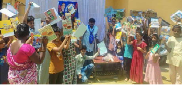
మల్లాజిగిరి, ఏప్రిల్ 14, (విజన్ ఆంధ్ర): భారత రాజ్యాంగ నిర్మాత దాక్టర్ బాబా సాహెబ్ అంబేద్కర్ ఆదర్శ ప్రాయుడు అని వికలాంగుల హక్కుల