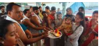
మెట్ పల్లి ఏప్రిల్ 01 (విజన్ ఆంధ్ర):

-అయ్యప్ప స్వామికి పంచామృత అభిషేకాలు - అలయం లో ప్రదక్షిణ లు చేసిన భక్తులు