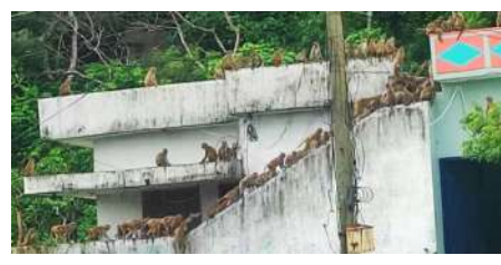
రుద్రంగి, ఏప్రిల్ 1 (విజన్ ఆంధ్ర):

- ఇళ్లలోకి చొరబడి వస్తువులు ధ్వంసం - భయాందోళనలో గ్రామస్థులు... - రోడ్లపైకి రావడంతో ప్రమాదాలకు గురవుతున్న వాహనదారులు