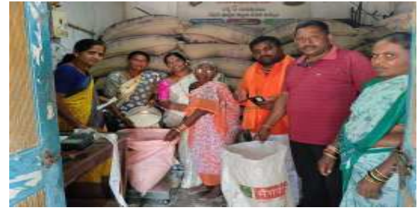
ఒకేసారి రేషన్ షాప్ లలో మూడు నెలల

దశలపై సమగ్ర అవగాహన ఇవ్వబడిందన్నారు. తమ ప్రాంతాలలో ప్రజలకు ఎన్ఐఆర్ ప్రక్రియపై అవగాహన కల్పించాలని అన్ని రాజకీయ పార్టీల ప్రతినిధులకు సూచించడం జరిగిందన్నారు. ఈ ప్రక్రియ సజావుగా, సమర్థవంతంగా జరిగేలా సహకరించాలని కోరారు. ఇది విస్తృతమైన ముఖ్యమైన కార్యక్రమం కావున, బూత్ లెవల్ ఆఫీసర్లు బూత్ లెవల్ ఏజెంట్లను నియమించి వారికి మద్దతు పొందాలని తెలిపారు. ఈ సమావేశంలో, విస్తృత సవరణ ప్రక్రియలో బిఎల్ఓ లు తమ బాధ్యతలను సమర్థవంతంగా నిర్వహించేందుకు పరిపాలన రాజకీయ ప్రతినిధులు సహకరించాలని సూచించారు. సాధారణ ప్రజలు మరోసారి ప్రశాంతంగా ఉండాలని అధికారిక వనరుల ద్వారా మాత్రమే సమాచారం తెలుసుకోవాలని, అవసరమైనప్పుడు ఎన్నికల అధికారులకు సహకరించాలని ఆయన కోరారు.