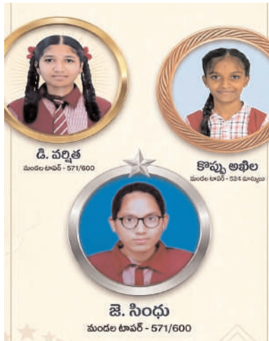
తెలియజేశారు. రాబోయే రోజుల్లో మరిన్ని ఉన్నత శిఖరాలను అధిరోహించాలని విద్యార్థులను ఆకాంక్షించారు.