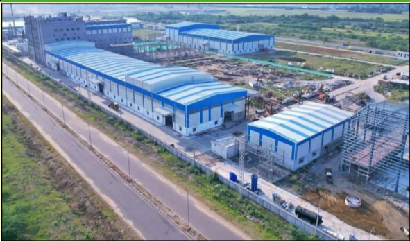
వరంగల్ ఏప్రిల్ 24 (విజన్ ఆంధ్ర) : వరంగల్లోని కాకతీయ మెగా టెక్స్టైల్ పార్కు నిర్మాణానికి కేంద్ర ప్రభుత్వం గ్రీన్ సిగ్నల్

తొలి విడతగా రూ.30 కోట్లు విడుదల లోక్సభలో ఎంపీ కడియం కావ్య ప్రస్తావనపై కేంద్రం స్పందన అభివృద్ధిలో వరంగల్ మరో ముందడుగు